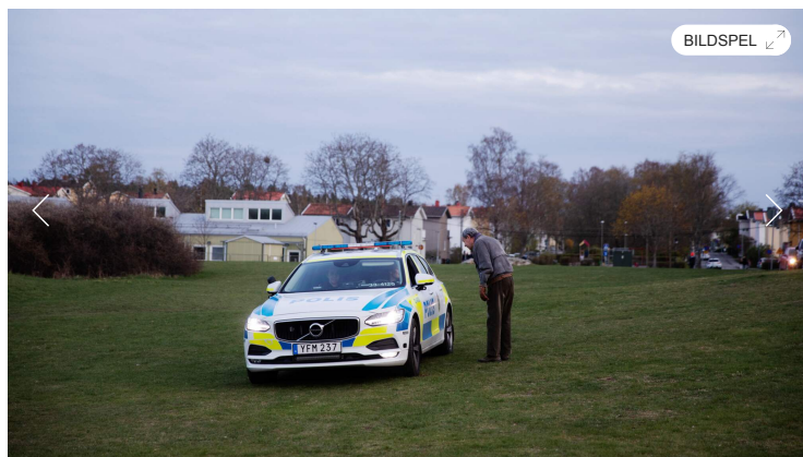
Bild 1 av 3 Polisen håller koll på hur många som är på Snorreängen.

– Det är en konstig valborg. I vanliga fall brukar det vara brukar stånd med pilkastning och sockervadd, säger Birgitta Brynielsson.